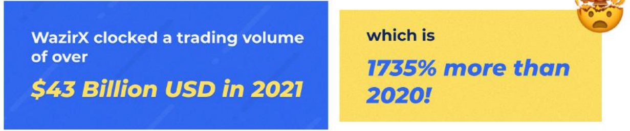
Trading volume (in billion USD)

যত বেশি মানুষ ক্রিপ্টো সম্পর্কে পড়তে শুরু করেছে এবং এই উদীয়মান বিকল্প সম্পদে বিনিয়োগ করতে শুরু করেছে, WazirX ব্যবহারকারী সাইনআপে ব্যাপক বৃদ্ধি দেখছে যার ফলশ্রুতিতে আমাদের ১০ মিলিয়ন ব্যবহারকারী অতিক্রম করেছে। WazirX $৪৩ বিলিয়ন ইউএসডি লেনদেন সীমা অতিক্রম করেছে ২০২১ সালে যা ২০২০ সালের থেকে ১৭৩৫% বেশি!