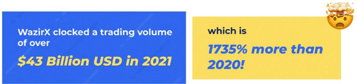
Trading volume (in billion USD)

જેમ જેમ વધુ લોકોએ ક્રિપ્ટો વિશે વાંચવાનું શરૂ કર્યું અને આ ઉભરતા વૈકલ્પિક સંપત્તિ વર્ગમાં રોકાણ કરવાનું શરૂ કર્યું, વઝીરએક્સ(WazirX)માં વપરાશકર્તા સાઇનઅપ્સમાં મોટો ઉછાળો જોવા મળ્યો જેના કારણે અમે 10 મિલિયન ઉપયોગકર્તાઓને પાર કરી ગયા. વઝીરએક્સ(WazirX)એ 2021માં 43 અબજ ડોલરથી વધુનું ટ્રેડિંગ વોલ્યુમ પણ કર્યું હતું જે 2020 ની તુલનામાં 1735% વધુ છે!