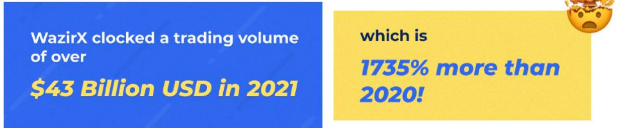
Trading volume (in billion USD)

जसजसे अधिकाधिक लोकांनी क्रिप्टोबद्दल वाचायला सुरुवात केली आणि या उदयोन्मुख पर्यायी मालमत्ता वर्गामध्ये गुंतवणूक करायला सुरुवात केली, तसतसे वझिरएक्सच्या युजर साइनअपमध्ये मोठ्या प्रमाणात वाढ दिसून आमच्या युजरनी 1 कोटीचा आकडा ओलांडला . वझिरएक्सचा 2021 मध्ये $4300 कोटी USD पेक्षा जास्त व्यापार झाला, जो 2020 च्या तुलनेत 1735% अधिक आहे!